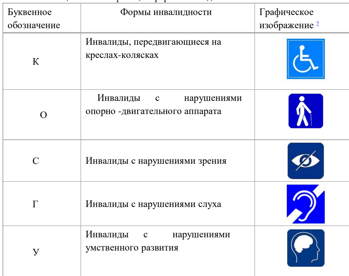
Таблица 2. Классификация форм инвалидности

В зависимости от формы инвалидности лицо сталкивается с определенными барьерами, мешающими ему пользоваться зданиями, сооружениями и предоставляемыми населению услугами наравне с остальными людьми.